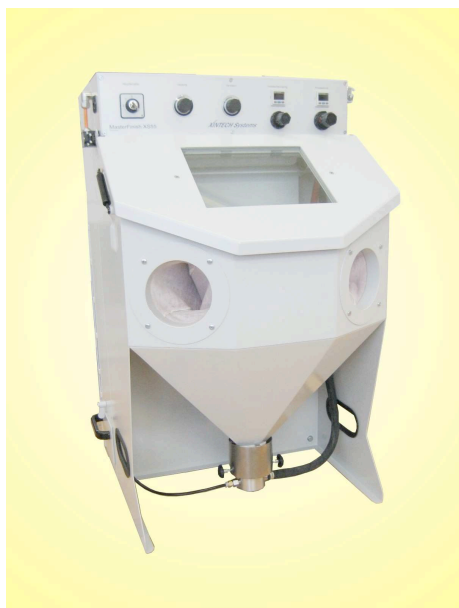
Installation de microsablage à injecteur MasterFinish XS 55

Sablux Technik AG Bramenstr. 14 CH-8184 Bachenbülach Suisse Tél. 043 411 44 22 Fax 043 411 44 23 http://www.sablux.ch