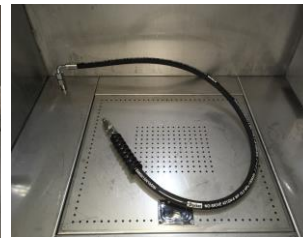
Hochdruckpistole oder Griffstück (frei wählbar)