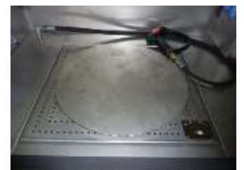
Drehteller aus Edelstahl 1.4301