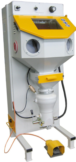
MasterClean XS 55

Sablux Technik AG Bramenstr. 14 CH-8184 Bachenbülach Schweiz Tel. 043 411 44 22 Fax 043 411 44 23 http://www.sablux.ch